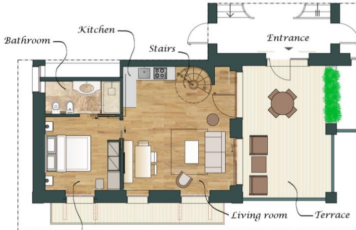
SUITE CAVOUR - PIANO PRIMO CAVOUR SUITE - FIRST FLOOR