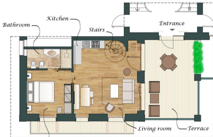
SUITE CAVOUR - PIANO PRIMO CAVOUR SUITE - FIRST FLOOR