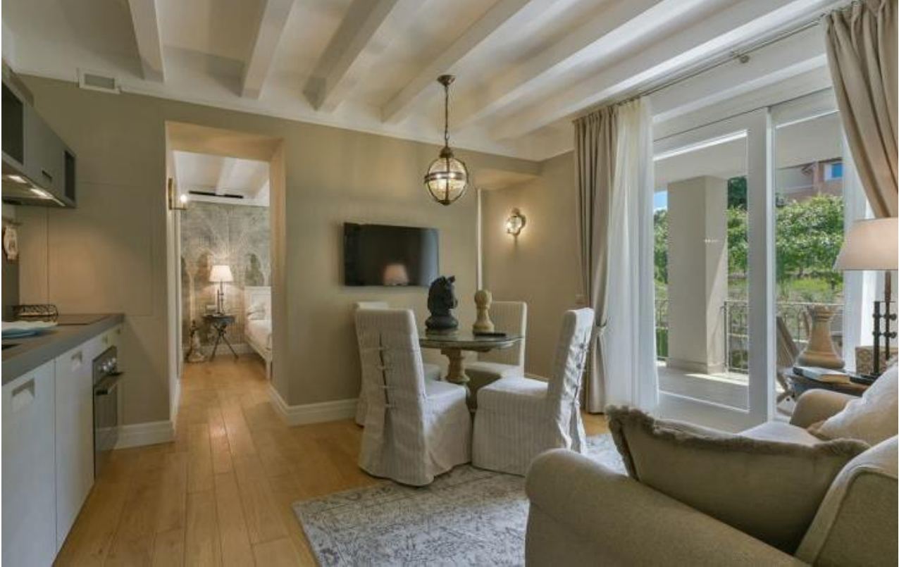
Falletti stue/oppholdsrom og kjøkken