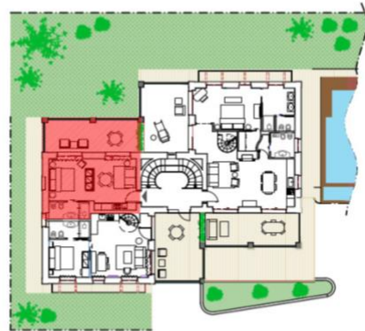
APPARTAMENTO FALLETTI - PIANO PRIMO FALLETTI APARTMENT - FIRST FLOOR