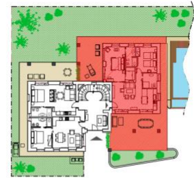
APPARTAMENTO NAPOLEONE - PIANO TERRA NAPOLEONE APARTMENT - GROUND FLOOR