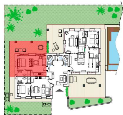
APPARTAMENTO PERTINACE - PIANO TERRA PERTINACE APARTMENT - GROUND FLOOR